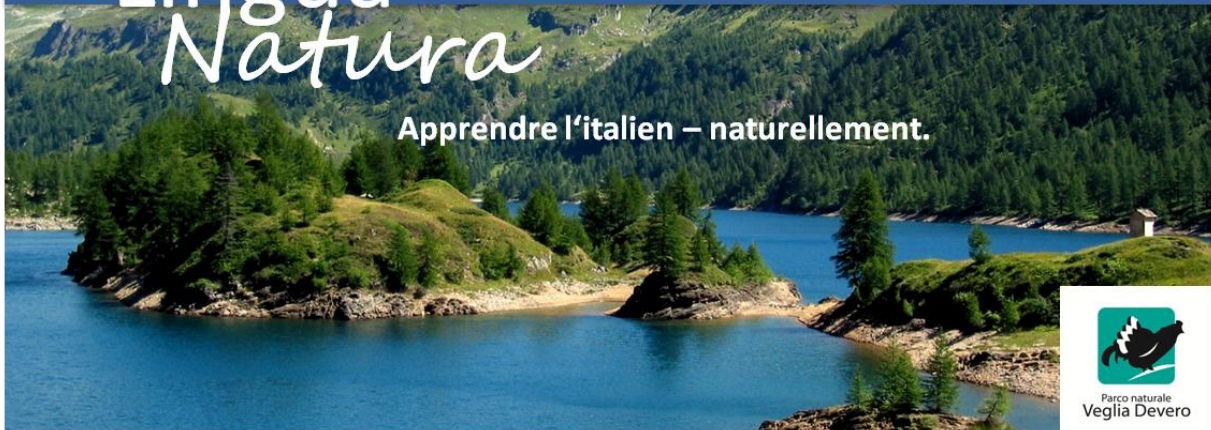
Lac de Devero, 1850 m