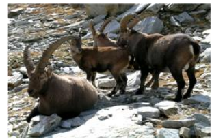
Bouquetins du parc

Situé à l'extrême nord du Piémont, le parc naturel Alpe Veglia et Alpe Devero est le pionnier des parcs naturels régionaux. Fondé en 1978, il jouxte le parc paysager suisse du Binntal au nord, auquel il est lié historiquement par l'ancienne route commerciale de la "Bocchetta d'Arbola (Albrunpass)".