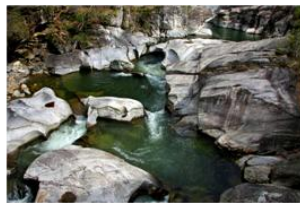
Marmittes des géants