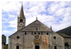
Eglise de San Gaudenzio à Baceno