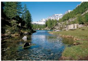
Lac des Streghe 1760 m