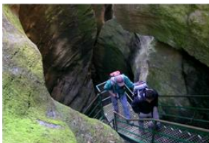
Orridi di Uriezzo