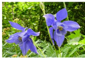
Ancolie des Alpes, une rareté dans le parc