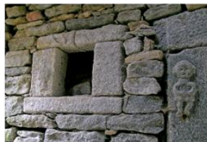
Décoration sculptée à Cuggina