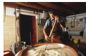
Herstellung des „Gruyère d'alpage“

Sonntag Individuelle Anreise & Begrüssung 18:00 Uhr: Ankunft Gemeinsames Abendessen Kennenlernen, Infos zum Ablauf der Woche