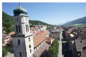
Collégiale von St-Imier